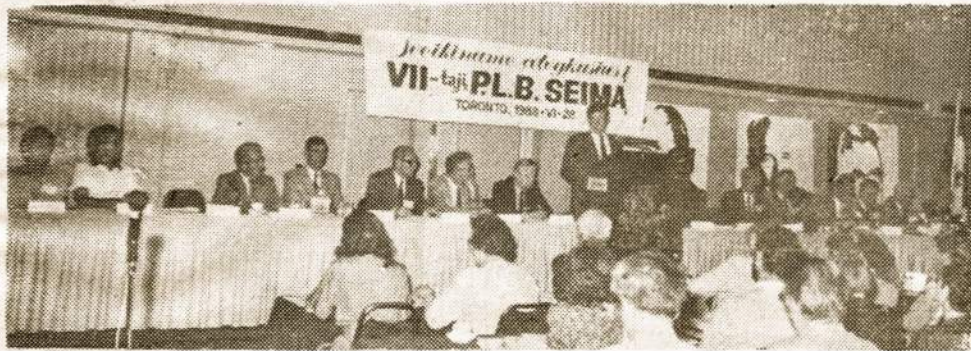
12-kos kraštų atstovai VII-jame P.L.B. Seime 1988-VI-28-30 Toronte.

1988 metų birželio mėn. nuo 28 iki 30 d. Toronto mieste, Kanadoje įvyko VII Pas. Liet. Bendrės Seimas, kuriame dalyvavo iš 13 pasaulio kraštų atstovai (apie 200 asmenų) iš kurių 100 atstovų.