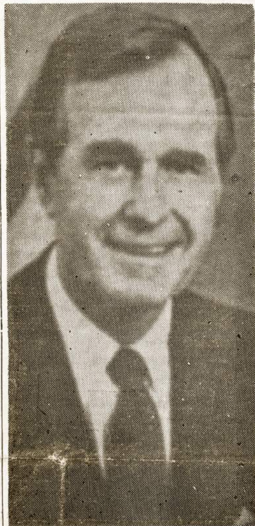
Sausio 20-ją perėmė valdžią naujas JAV prezidentas, buvęs vicepresidentu GEORGE BUSH

Burmos vyriausybė pagrasino šaudyti visus, kurie protestuoja prieš vyriausybę. Tėv. Žib.