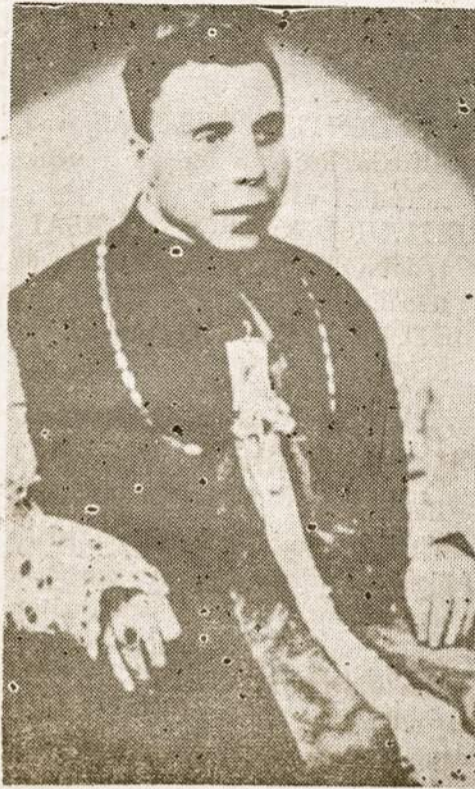
Tikėjimo ir tikinčiųjų ryžtingas gynėjas