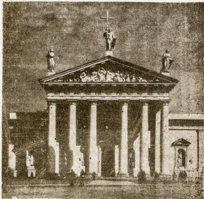
Vilniaus Katedra susilaukė savo Ganytojo ir Šv. Kazimiero sugrįžimo bei savo atšventinimo.

Maskva. Veik prieš mėnesi prasi-dėję Sibire anglių kasyklose atreikai išsiplėtė į visas sovietų anglių kasyklas. Nuo Šiaurės Arktikoj Vorkutos iki Kazajstan, Donbaso Ukrainoje, Karaganda ir Rostov prie Donojaus, Don-