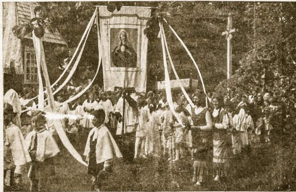
Velykų procesija Lietuvoje. Junkimės prie jos nors mintimi!

Rumunijos princesė Ileana, kuri prieš 42 metus pabėgo nuo komunistų iš savo krašto, tapo vienuole ir šiuo metu yra vienuolyno vyriausiąja Motina Aleksandra Ellwood City, Pensylvanijos valstijoje. Ji yra Anglijos karalienės Viktorijos ir Rusijos caro Aleksandro vaikaitė.