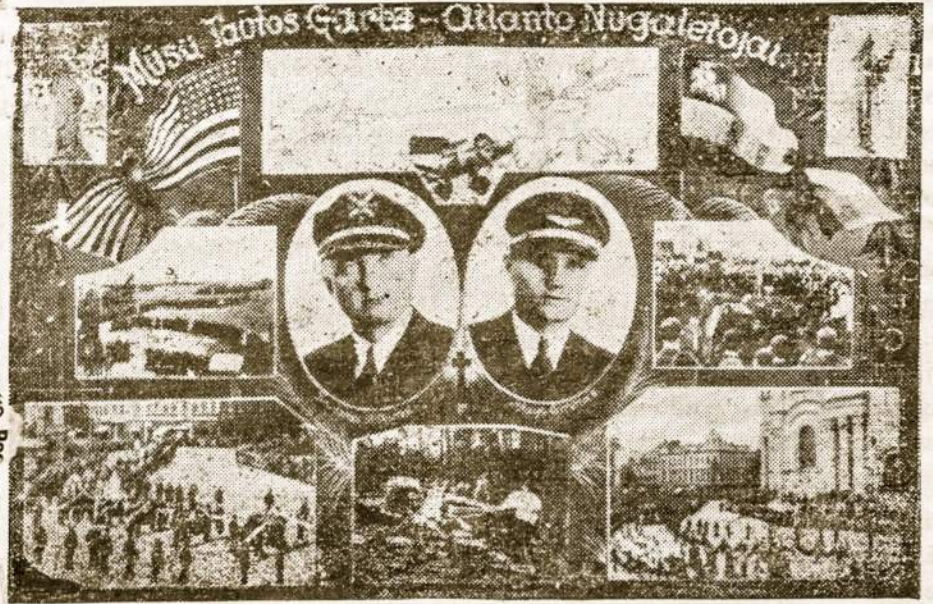
1933 - VII - 16 Darius ir Girėnas perskridę Atlantą žuvo Soldino miške, Vokietijoje, pašauti neišaiškinto priešo. Garbė Jiems!

Taigi jei kairysis blokas panorėtų perimti viską iš eilės: Vyriausybę ir Aukščiausios Tarybos Prezidiumą, paskutines komisijas, kurios dar visai neužvaldytos, suardyti Valstybės kontrolę, Komisiją KGB veiklai Lietuvoje tirti, Aukščiausios Tarybos apsaugą, pasijungti Respublikinę rinkiminę komisiją, vienintelį opozicinį didesnio tiražo laikraštį "Lietuvos aidą" monopolizuojant spaudą, susigrąžinti Televizijos ir radio politinę monopoliją ir kontrolę, o po to jau turint patikimą Rinkiminę komisiją ir bejėgį teismą, galima būtų surengti dar vienus Liaudies Seimo rinkimus... O tokia perspektyva kelia Lietuvoje didžiulį nerimą, todėl neturi stebinti nei aštrūs protestai, nei tiesūs klausimai. Aš tikrai neketinu dangstyti perversmo, jeigu jis bus tęsiamas. Tat išrinkime Seimą, ir kuo greičiau! Siūlau daryti tai rugpjūčio mėnesį, gal 23-ąją, kaip galvoja berods estai. Tuo būtų užbaigta mūsų stebėtinai taiki ketverių metų revoliucija - dainuojanti ir neš-