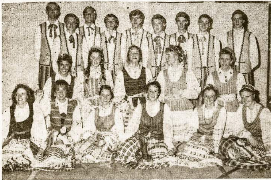
Lietuvių Susivienijimo Argentinoje tautinių šokių ansamblis "Dobilas" 1992 m. liepos 7 d. kartu su kitais pasaulio lietuviams smagiai koncertavo Čikagoje X-ojoje šokių šventėje. Ansamblio vadovas E. Čikota.

Mielas skaitytojau, ar jau užsimokėjai LAIKO prenumerata?