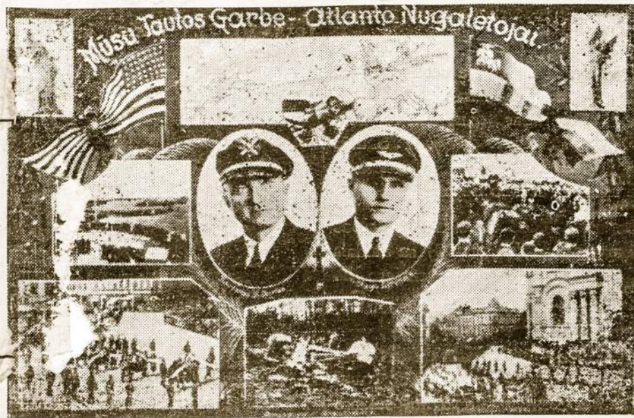
1933 - VII - 16 Darius ir Girėnas perskridę Atlantą žuvo Soldino miške, Volketijoje, pašauti neišaiškinto priešo. Garbė Jiems!