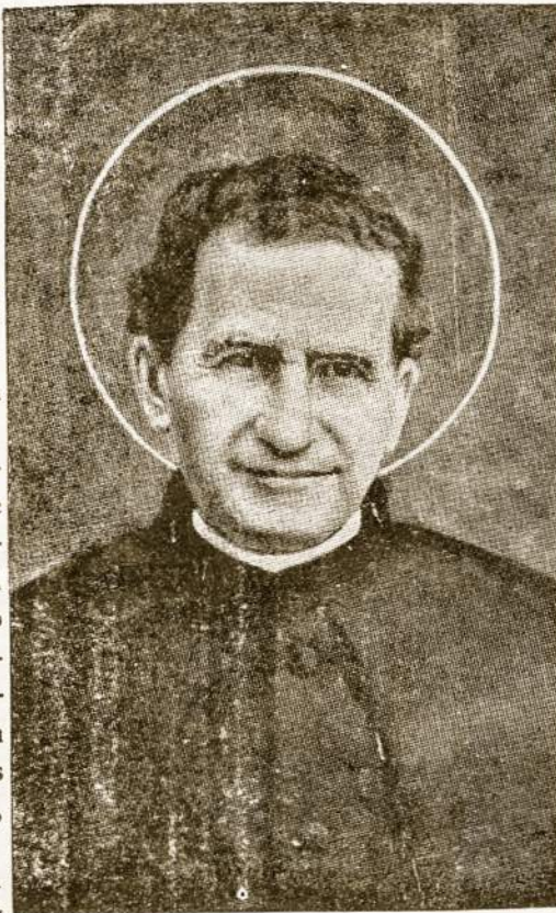
Šv. Jonas Don Bosco