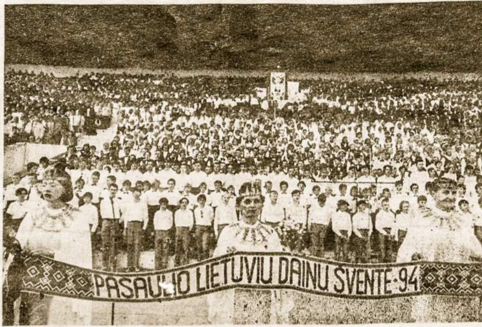
Pasaulio Lietuvių Dainų šventėje Vingio parke-Vilniuje, dalis dainininkų iš 12.000 dalyvavusių choristų.

Pagyvėjimą sukėlė pučiamųjų orkestrų maršai ir polka, bet nenusileido ir vaikų bei jaunimo chorai. Sudai-