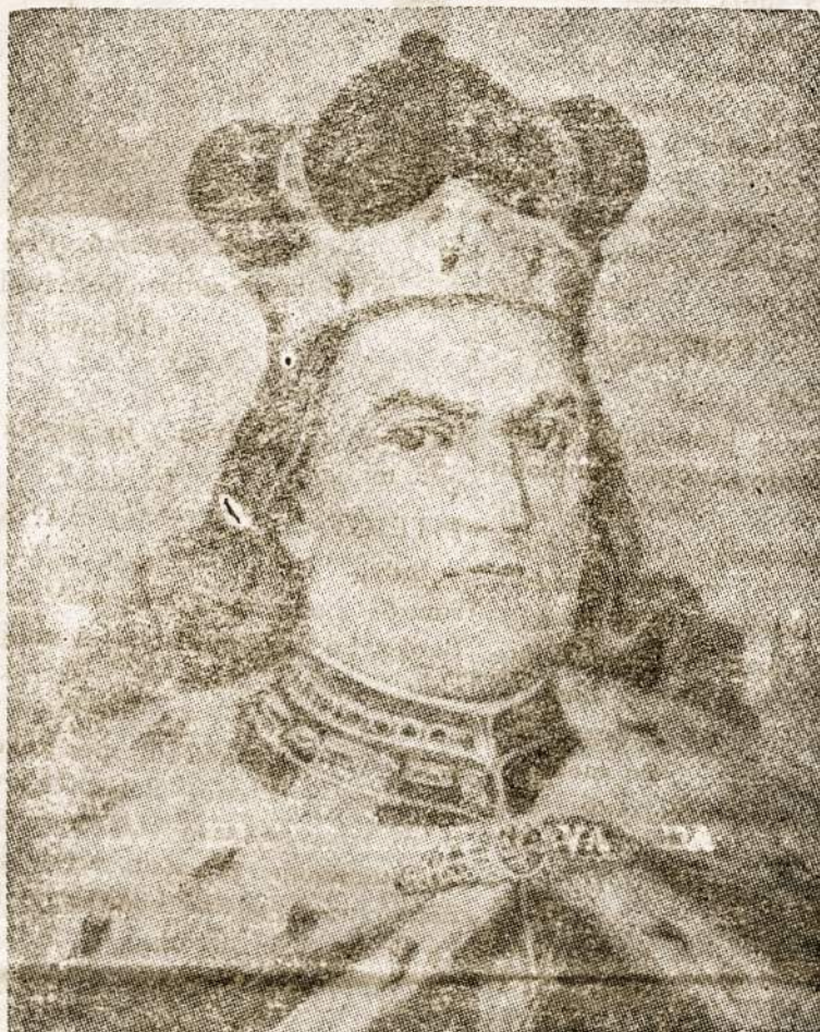
Vytautas Didysis Lietuvos karalystės kurėjas Krikščionybės platintojas, Europos gynėjas

Lietuvos Prezidentas Algirdas Brazauskas kalbėdamas per televiziją apie vokiečių-sovietų pasirašytus slaptuosius protokolus sakė kad "šis gėdingas nepriklausomų valstybių pasidalijimas Europoje atvėrė vartus antrajam pasauliniam karui, atnešant didelę nelaimę kontinentui ir pasauliui, kainavo milijonus žmonių aukų, o kai kurios valstybės, jų tarpe Lietuva, pusę šimtmečio neteko nepriklausomybės. 1939 m. rugpjūčio 23 d. lėmė Lietuvos žmonių dvasinį ir fizinį genocidą, vykdomi masiniai areštai ir tremimai". Pasisakyme A. Brazauskas prisiminė 1990 m. Lietuvos atkurtą nepriklausomybę. Ši pergalė, jo žo-