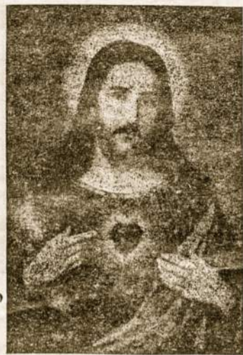
Kristus mums kalba evangelijose

Popiežiaus Jono Pauliaus II laiškas vaikams neturi precedentų-pirmą kartą Visuotinėse Bažnyčios ganytojas tiesiogiai kreipiasi į vaikus kaip į pašnekovus, kalbasi su jais kaip su Bažnytinės šeimos nariais. Laiško stilius yra paprastas, bet rimtas, nenusaldintas. Popiežius kalbasi su vaikais apie didžiausias krikščioniškas vertybes - bendravimą su Dievu, meilę, solidarumą, maldą. "Dieviškasis kūdiki, pa-