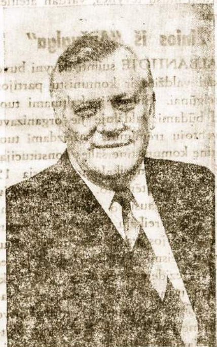
Dr. Algirdas Brazauskas Lietuvos Prezidentas

Algirdas Mykolas Brazauskas, gimęs 1932 Rokiškyje, inžinierius, 1965 m. buvo Pramonės Ministras, vėliau deputatas - Planavimo Komiteto pirmininkas; 1974 gavo Ekonomijos daktaro titulą; 1988 išrinktas KP (komunistų partijos) pirmuoju sekretoriumi, aktyviai dalyvavo Sąjūdyje, iki Lietuvos Nepriklausomybės atstatymo 1990 kovo 11 d.; KP nustojus veikti, persiorganizavo į Lietuvos Demokratinę Darbo Partiją (LDDP); 1992 išrinktas Seimo pirmininku; 1993 gavo 61% balsų daugumą išrinktas Lietuvos Respublikos Prezidentu.