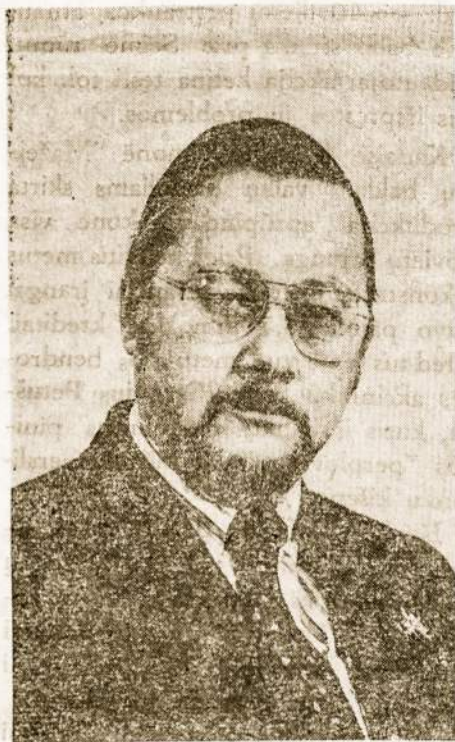
Prof. VYTAUTAS LANDSBERGIS