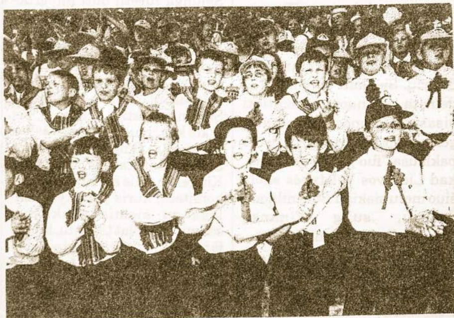
Moksleivių dainų ir šokių šventė, skirta Lietuvos mokyklos 600 metų jubiliejui paminėti Vilniuje Vingio parke.

Generalinis Prokuroras Kazys Pednyčia teigia, kad šiuo metu