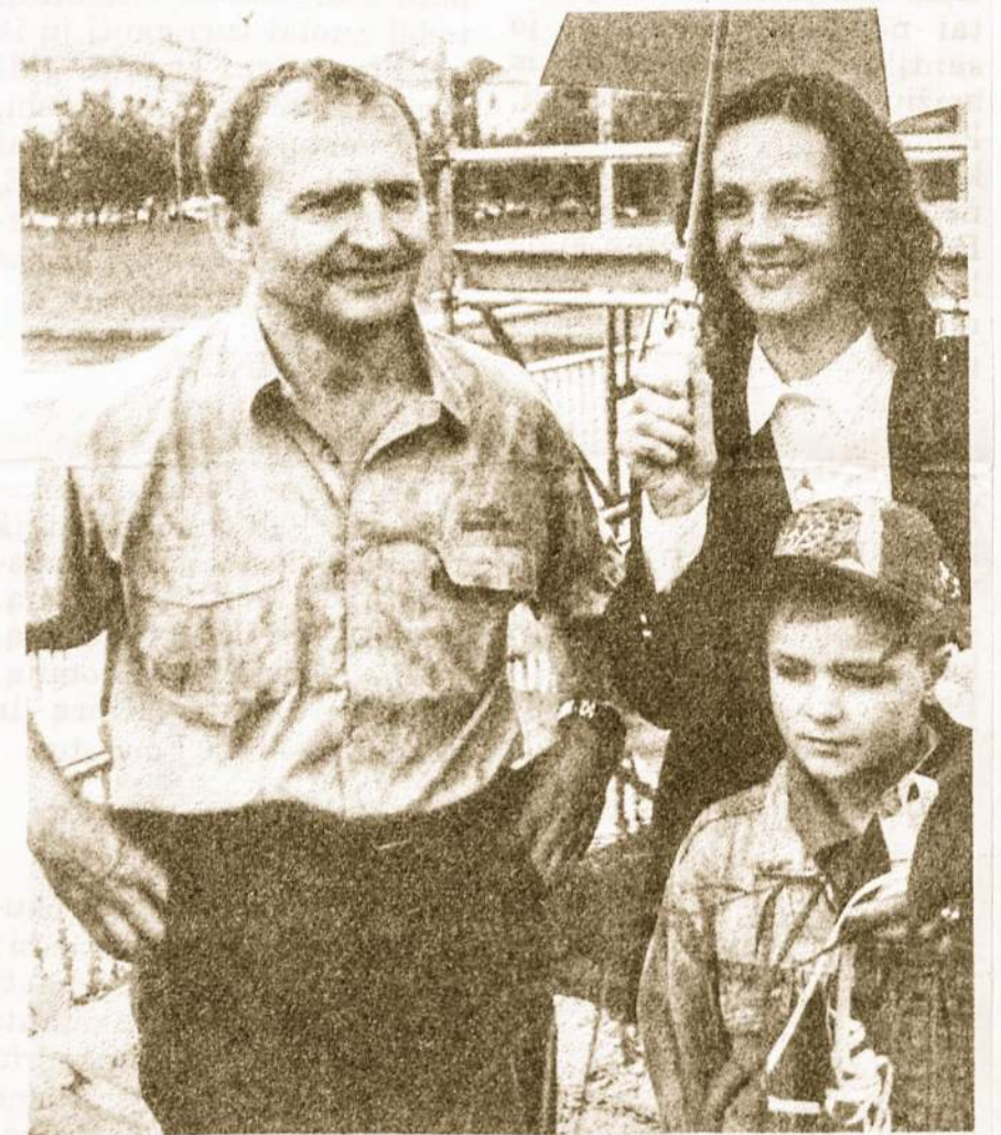
Lakūnas Jurgis Kairys su šeima po skrydžio po Baltuoju tiltu. Vilniuje.