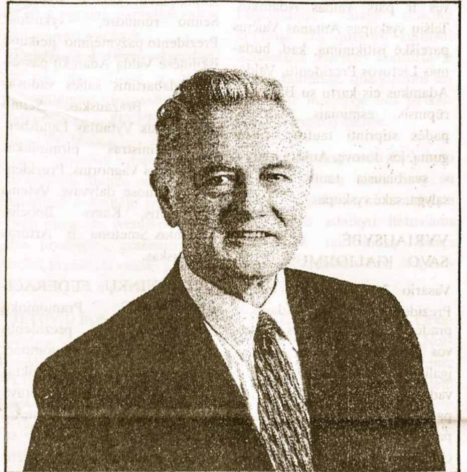
Naujas Lietuvos Prezidentas - VALDAS ADAMKUS

Prezidentas Algirdas Brazauskas sausio 6 d. susitikęs su išrinktuoju Lietuvos vadovu Valdu Adamkumi, pusantros valandos kalbėjosi apie valdžios perdavimo reikalus. "Buvau supažindintas su Prezidentūros struktūra, valstybės vadovo reikalų perdavimo iš vienu rankų į kitas", teigė Adamkus. Susitarta, kad V. Adamkus bet kuriuo metu galės kreiptis į A. Brazauską klausti, aptarinėti, svarstyti tai, kas turi būti išspręsta iki kadencijos pradžios. A. Brazauskas valstybės tarnybą Prezidento poste baigia vasario 25 d. Tą pačią dieną Prezidentu bus priesaiki-dintas Valdas Adamkus, o valstybės vadovo pareigas pagal Prezidento įstatymą pradės eiti vasario 26 dieną.