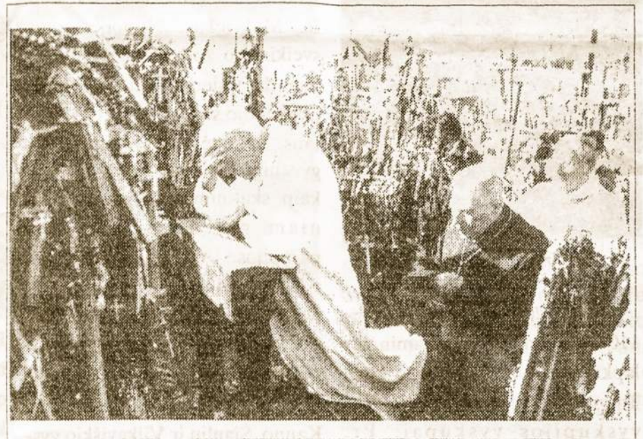
Pop. Jonas Paulius ir kardinolas Vincentas Sladkevičius Kryžių kalne