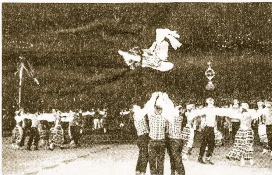
Lietuvos jaunimas šokant "iškėlė" vadovės nuopelnus Kalnų parke vakare

Lietuvos ir savo kraštų vėliavas, žygiavo per Viilniaus gatves iki Vingio parko. Ten juos pasitiko labai daug žmonių... ir lietus. Visus pasveikino ir padėkojo Lietuvos Respublikos Prezidentas Valdas Adamkus.