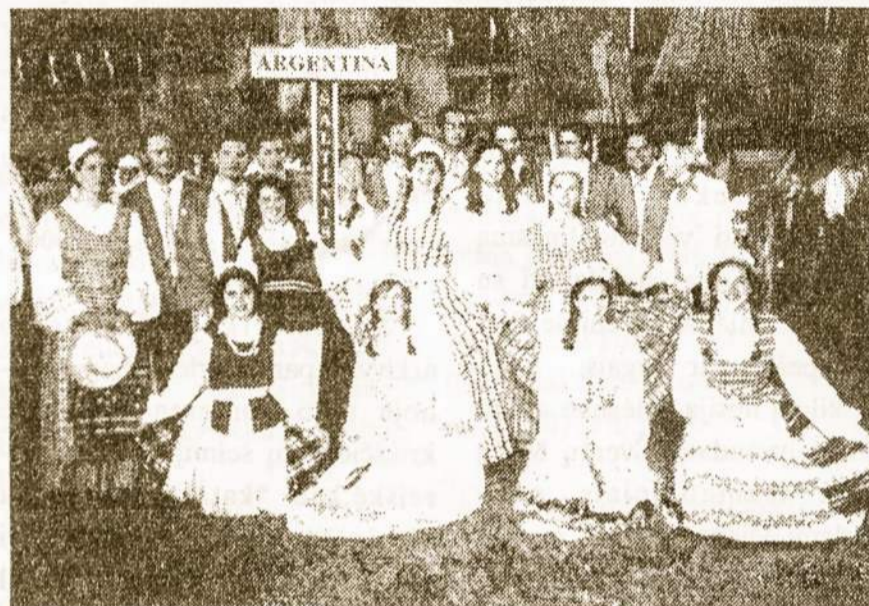
"Šaltinio" šokių ansamblis atstovavo Argentiną šokėjus.

samblių iš viso: Lietuvos miestų, jų tarpe ir 15 ansamblių iš užsienio. Argentiną atstovavo "Šaltinio" ansamblis iš Rosario, su pilna šokėjų grupe. Šokių šventė prasidėjo su iškil-