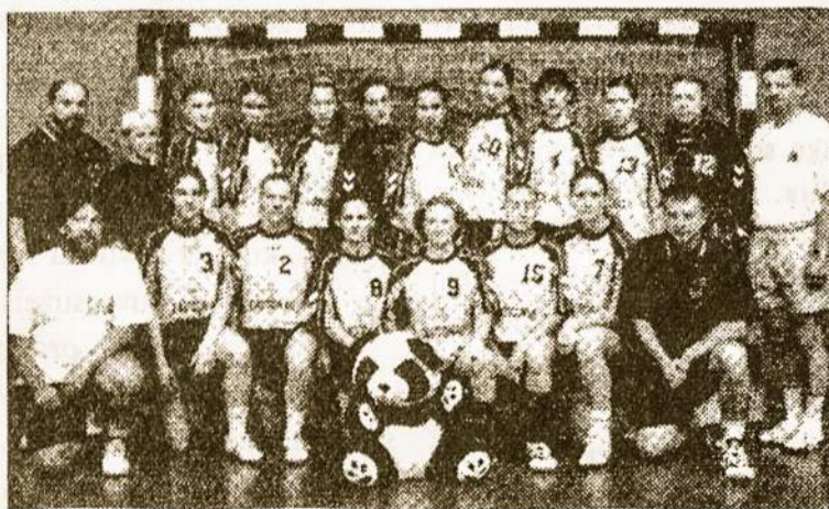
Europos rankinio vicečempionė Lietuvos jaunių rinktinė.