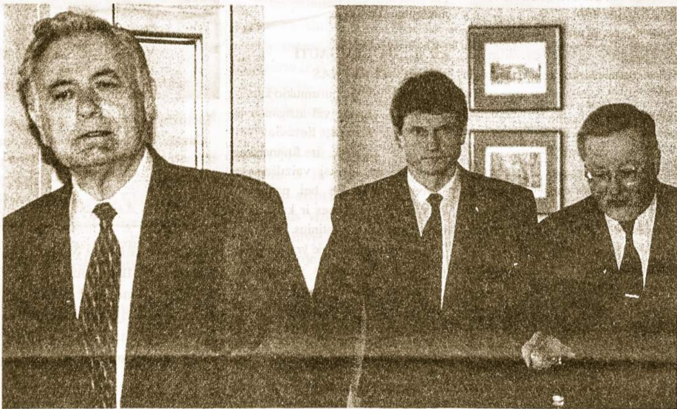
Vytautas Landsbergis užtikrino remsiąs Rolandą Paksą asmeniškai ir kaip Seimo Pirmininkas

lų pritarimą, todėl manau, kad tokios situacijos mes turėtume išvengti", kalbėjo buvęs Vilniaus meras, kartu tvirtindamas, kad susitarti turėtų padėti ir jo pavardė, kuri lotyniškai reiškia taiką.