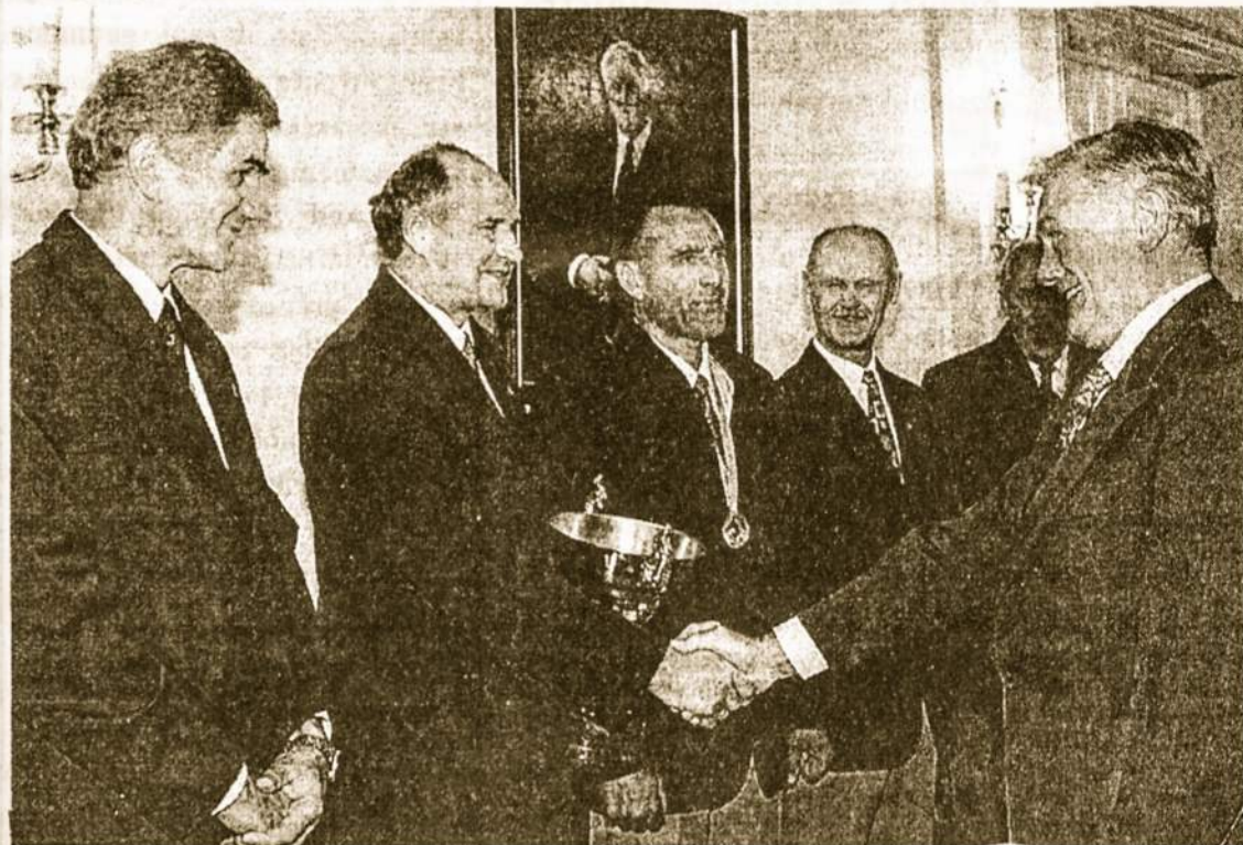
Lietuvos Prezidentas Valdas Adamkus spaudė rankas čempionams.