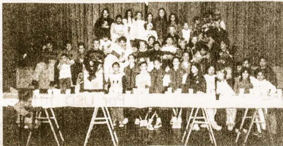
Dalyviai Vaikų festivalio, įvykusio 1999 m. rugpiučio 7 d. Lietuvių Susivienijimo patalpose.