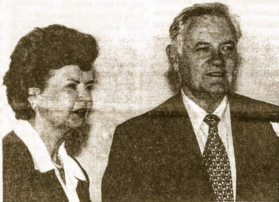
Vaira Vike - Freiberga: "Esame pasiryžę vieni kitus paremti"

tinkamą dieną. Pasak jos, taip pat buvo išreikštas žvejų susirūpinimas dėl žvejybos plotų. Latvijos Prezidentės nuomonė, tai gali sukelti svarstymų Parlamente, bet neturėtų sutrukdyti tarpvalstybinės sienos sutartį. Lietuvos Prezidentas tam pritarė, sakydamas, kad Lietuva ratifikuos pasirašytą sutartį. "Tokie klausimai gali būti išspresti tik demokratiniu būdu", pabrėžė V. Adamkus.