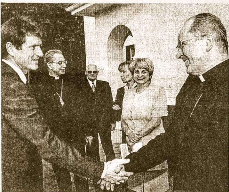
Premjeras su vyskupais aptarė Lietuvos ir Vatikano bendradarbiavimą bei bažnyčių tvarkymo problemas.