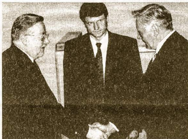
Trijų šalies vadovų - Seimo pirmininko V. Landsbergio, premjero R. Pakso ir Prezidento V. Adamkaus santvarė truko tik penkis mėnesius.

Lietuvos Prezidentas Valdas Adamkus neparėmė, bet ir neužkirto kelio sutarties su "Williams International" pasirašymui, nes jo žlugimas galėjo turėti Lietuvai dar skaudesnių padarinių. Šalies vadovas patvirtino: "Ne parėmiau sutarties pasirašymo, nes manau, kad ne viena