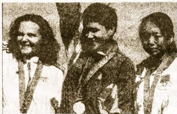
Po apdovanojimo Sidnėjuje: olimpinė čempionė Daina Gudžinevičiūtė (viduryje), sidabro medalio laimėtoja prancūzė D. Rasine (kairėje) ir bronzos apdovanojimą iškovojo kinė Gao E.

Lietuvos sportininkė, 34 metų Daina Gudžinevičiūtė tapo Sidnėjaus olimpinė žaidimų moterų stendinio šaudymo transejinėje aikštelėje čempionė. Sėkmingiausiai pasirodžiusi kvalifikacinėse varžybose (71 pataikimas iš 75 galimų), finalinėje serijoje Lietuvos atstovė numušė 22 lėkšteles iš 25. Lietuvos atstovės rezultatas kvalifikacinėse varžybose yra olimpinis rekordas.