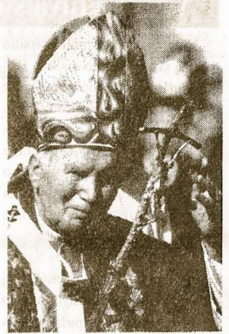
Šventas Tėvas Jonas Paulius II

Jaunimo dienos vyko per pačius karščius. termometro stulpelis dienomis pasikeldavo net keturiasdešimt laipsnių. Dėl to jaunuoliams gatvėse buvo dalijamas vanduo, stengtasi karščiausiomis dienomis valandomis neorganizuoti