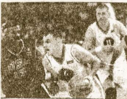
Veržiasi Šarūnas Jasikevičius, rungtiniosė su NBA olimpiadoje.