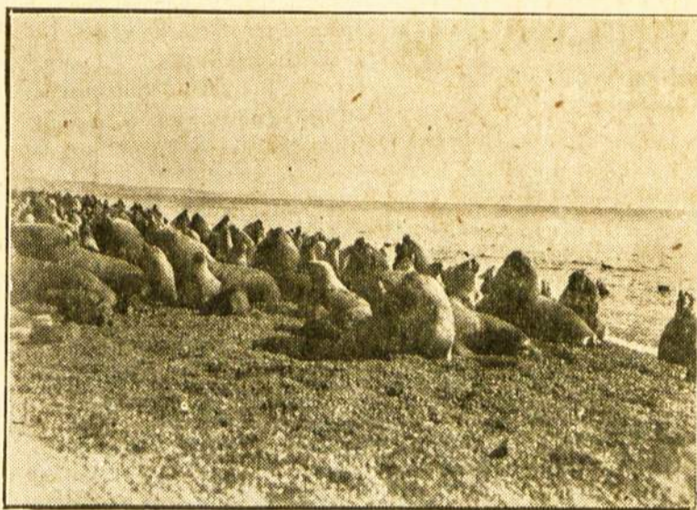
Ruoniai šildosi prieš saulę.

Ekspertų komisija, kuri rengia pasaulinę ekonominę konferenciją baigė savo darbus ir provizoriškai pasiūlė gegužės 1 dieną konferencijai atidaryti.