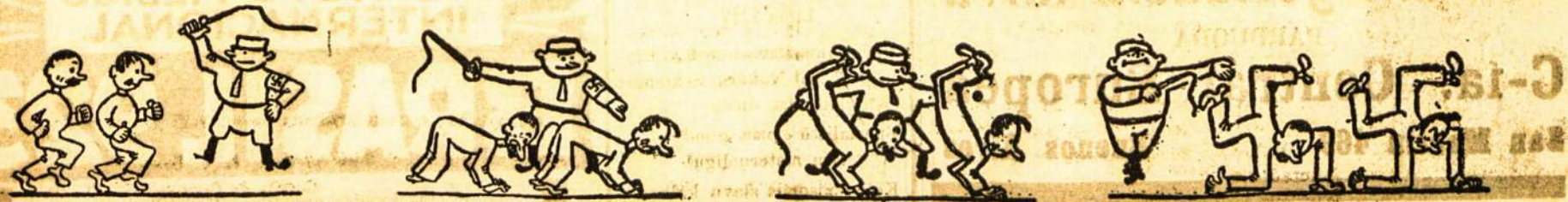
Taip dabar paruošiami Vokietijoje laikraščių redaktoriai. Nepaisant jų pirmųjų pasaulėžiūros visi virsta karšiais hitlerininkais.

Logiškas galvojimas. — Klausyk Jonai kodėl save vadini Argentiniečiu. Juk tavo tėvas ir motina lietuviai? — Bet juk aš esu gimęs Argentinoj. — O jeigu btum gimęs arklydėje? — Mano vyras savo kalba per sapną neduoda man užmigti. — Argi taip balsiai kalba? — Ne, bet aš noriu viską girdėti, ką jis kalba.