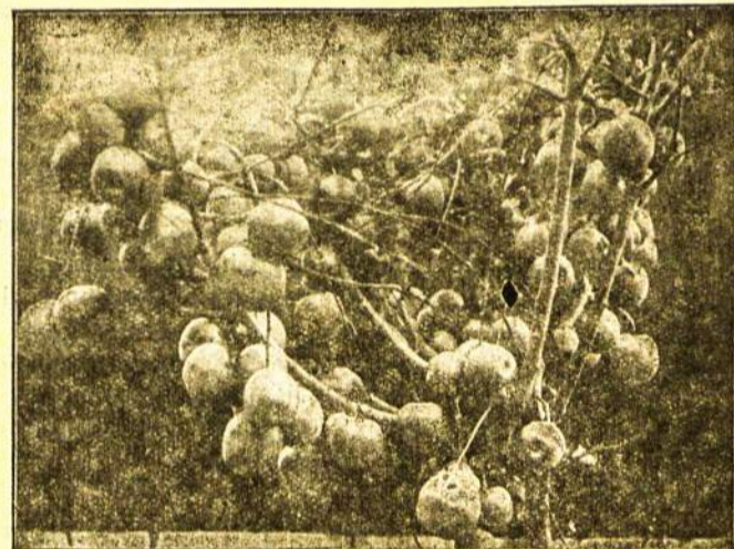
Vaisinga obelis, iš kurios kolonistai turės nemažai pajamų.