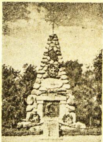
Paminklas žuvusiems kovose už Lietuvos nepriklausomybę, pastatytas Karo Muziejaus sodnelyj, Kaune.

Baigus gimnaziją tėvai dar stengėsi įkalbėt vykt į Seinus. Jam