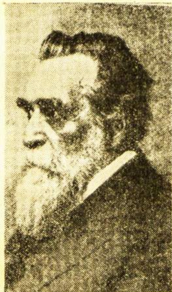
Dr. Janas Basanavičius Lietuvos laisvės pranašas

go tautos patriarchas. Užsivertęs Lietuvių Mokslo Draugijos darbais Vilniuje B. mirė vasario 16 d., t. y. tą dieną, kada buvo minimos 9-tos metinės Lietuvos nepriklausomybės sukaktuvės. Jis mirė Lietuvai nepriklausomybę iškovojęs, bet kuomet jis mirė Lietuvoje jau buvo įžeisti tie kilmūs obalsiai, kurie Lietuvos nepriklausomybės deklaracijoj buvo įrašyti, o būtent tie, kurie skelbė, kad Lietu-