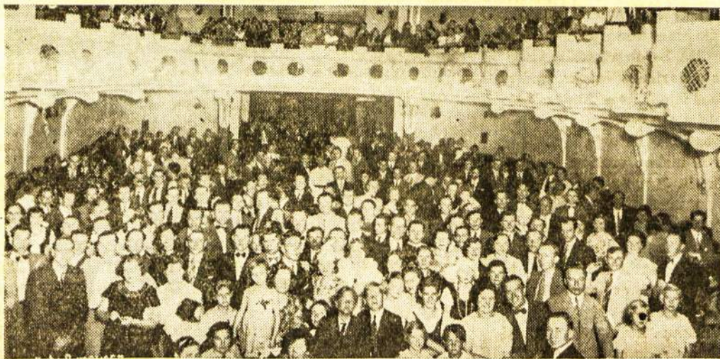
Balso baliaus - karnavalo pub likos dalis Jose Verdi teatro partertyje ir pirmame aukšte.