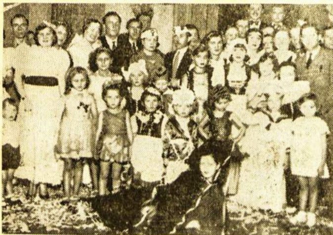
Maskaradiškais kostiumais pasipuošę Buenos Aires lietuviukai drauge su vyresniaisiais Arg. Liet. Balso baliuje kovo 9 d.

lino bilietus veltui, bet, anot vė- liau pas balsiečius atėjusių, — „Montekoje buvo tik penki ber- nai ir šeši mergai“, o Balso paren- gime dalyvavo virš 700 žmonių.