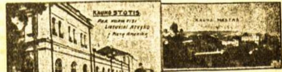
Lietuviška fotografija FOTO "LITO" Av. La Plata 1333

PASTABA: Adresą prašoma rašyti kaip galima aiškiau. Prenumeratas siūsti šiuo vardu ir adresu: „A. L. BALSAS“, CASILLA DE CORREO 303, Bs. Aires