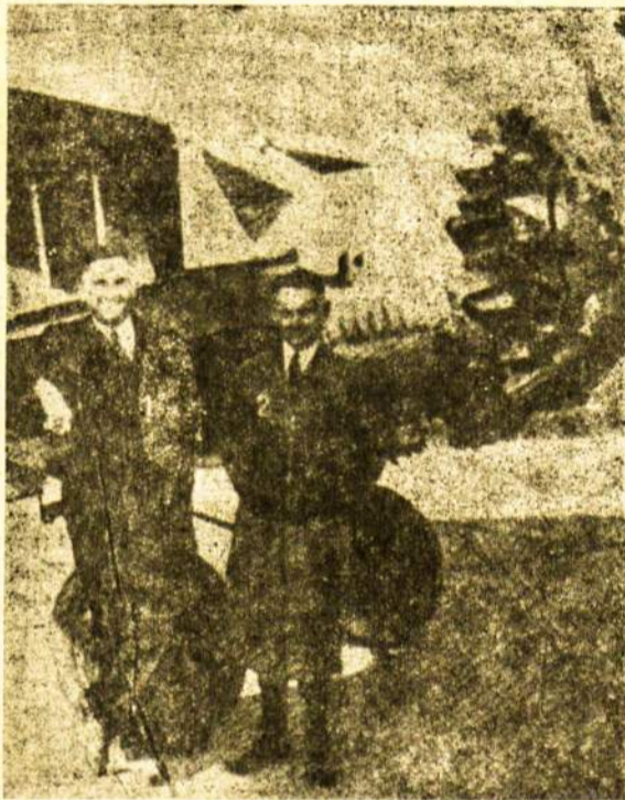
Darius ir Girėnas prie "Lituanicos I".

Lakūnams neilgai tenka svajoti. Žurnalistai su