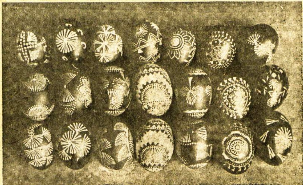
Lietuviški velykiniai margučiai. — Štai Jums 21 modelis lietuviškų margučių. Pabandykite taip išmarginti, kaip tai padaro mūsų sesutės Lietuvoje.