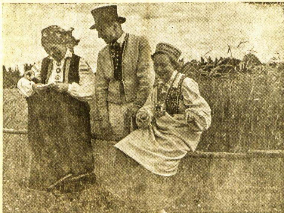
LATVIJOS VALSTIEČIŲ JAUNIMAS, TAUTINIAIS RŪBAIS PASIPUOŠĘS, prie rugių lauko šnekučiuojasi.

— Rumunijos karalius Karolis parlamento atidaryme pareiškė, kad jo šalis negrąžins karo metu užgrobto Vengrijos teritorijos dalies. Manoma, kad bus reformuota mažoji "ententė".