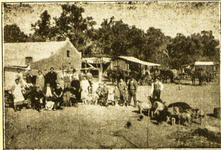
Argentino Čako gilumoj besikuriančių europiečių vatos plantatorių sodyba.

mai, DULR. turi "svarbesnių darbų". Ir tai, jau nėra kokia dovana, o tik paskola. (Paskolos iš DULR. prašė ir taipgi negavo Argentinos Lietuvos Centras, kuris kolonijos pastangomis nuosavius žemės sklypus kolonijai įgijo ir provizorinius Dr. Jono Basanavičiaus vardo namus Argentinos sostinės ribose pastatė. O tuom pačiu laiku keli šimtai tūkstančių litų atsijūsta iš Lietuvos sektantų spaudai ir popierinėms "organizacijoms". Paša l p o s