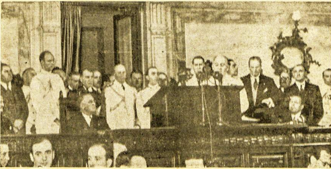
ARGENTINOS PARLAMENTO RŪMUOSE VYKSTA PANAMERIKOS TAIKOS KONFERENCIJA, KURIOJE DALYVAUJA VISŲ PIETINĖS, ŠIAURINĖS IR CENTRALINĖS AMERIKOS VALSTYBIŲ ATSTOVAI. U. S. A. PREZIDENTAS FRANKLIN D. ROOSEVELT (SĖDI KAIRĖJ) ATIDARĖ KONFERENCIJĄ 1-XII-1936. ARGENTINOS RESPUBLIKOS PREZIDENTAS DR. AGUSTIN P. JUSTO KALBA Į RADIO. JO KALBA TAPŲ TRANSLIUOTA PO VISAS AMERIKOS VALSTYBES.

Susiveinyjimo Lietuvių Argentinoje Pirmojo (V. Als.) Skyriaus rengiamas, įvyks šį sekmadienį, Gruodžio - Diciembre 13 d., 1936 m. Prasi- dės nuo pietų ir tęsis iki vėlyvos nakties. Savas bufetas, griausminga lietuvių muzika, šokiai ir žaidimai mažų, jaunų ir senjų. Val. Alsina, Villa Diamante, "Col. Alemana". Autob. Nr. 13 iš N. Pompeya veža iki vartų.