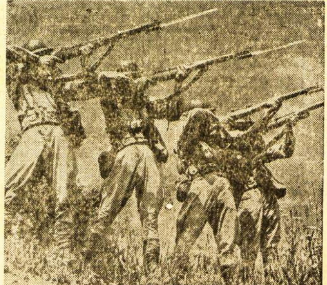
USA kareiviai daro karinius pratimus. Paveiksle matome kareivius su priešdūjinėmis kaukėmis.