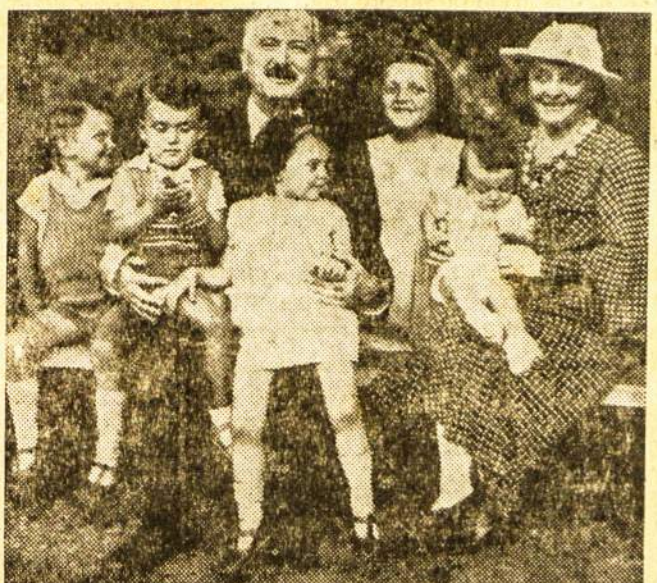
Prancūzijos respublikos prezidentas Dr. Lebrun su savo šeimyna, atostogų metu prie Alpių kalnų.

Minint generolo Jose de San Martin 88 metų mirties sukaktuves 17 - 8 - 38, Kordoboje įvyko baisi nelaimė. Vienas karo orlaivis pakliudė jezuitų bažnyčios bokštą. Jis taip smarkiai susitrenkė, kad orlaivio sparnas pakibo ant kryžiaus, o aparatas su lakūnais nukrito ant universiteto rūmų, kurie stovi greta minėtos bažnyčios. Pilotas ir jo padėjėjas sužeisti ir nugabenti ligoninėn kur pasimirė.