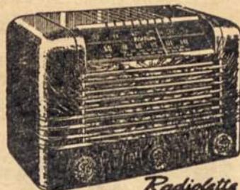
Radiolatte RCA Victor Modelo 51-X-1 Barzdžius ir Toscano, sav.

Av. Santa Fe 3870 — U. T. 72 2529 Radio aparatai, budėtojai, laikrodžiai, elektros reikmenų pardavimas. Pašaukus einame į namus taisyti radio aparatus, gazines ir elektros virtuves ir kitas mašinas.