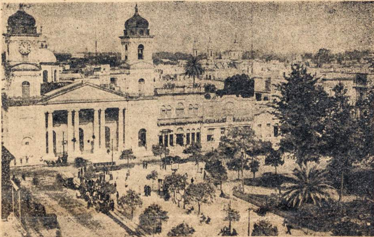
Argentinos Tukumano vaizdas, kur neseniai lankanties poniai prezidentienei, minios susigrūdime 7 žmonės žuvo ir virš 100 sužeista. Vyriausybė nukentėjusiems paskyrė $ 30.000.