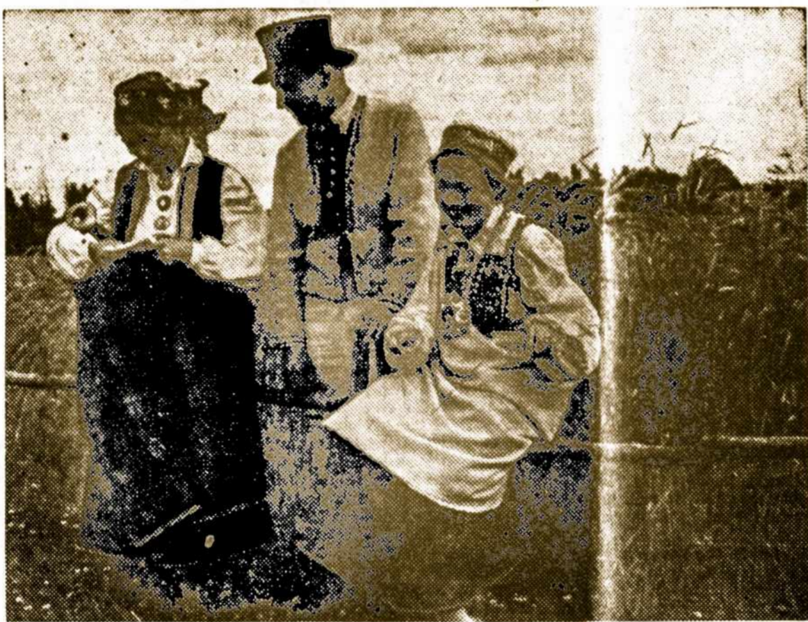
MUMS BROLISKOS LATVIŲ TAUTS JAUNIMAS SAVO TAUNINIJOSE RŪBUOSE. Latvijos Nepriklausomybės paskelbimo 31 metų sukaktį Latvijos Sąjunga Argentinoje mini 18. XI. 49 Buenos Aires salone „La Argentina“, koncertu ir prakalbotimis, 20. XI. 49 San Miguel Ev. Luit. bažnyčioje pamaldomis, o šį šeštadienį, 19. XI. 49 ruošia didelį vakarą visiems pabaltiečiams Lietuvių Klube, Boedo 737.