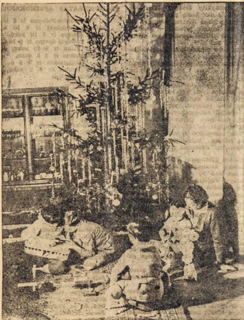
Kalėdinė eglutė — motinų ir jų vaikūčių džiaugsmas. Vien JAV šiemet bus papuosta apie 21.500.000 eglučių. Už tuos medelius ten sumokama 50 milijonų dolerių. Visa tai motinos daro savo vaikūčių džiaugsmui.

„A. L. Balsas“, Casilla de Correo 303, Bs. Aires.