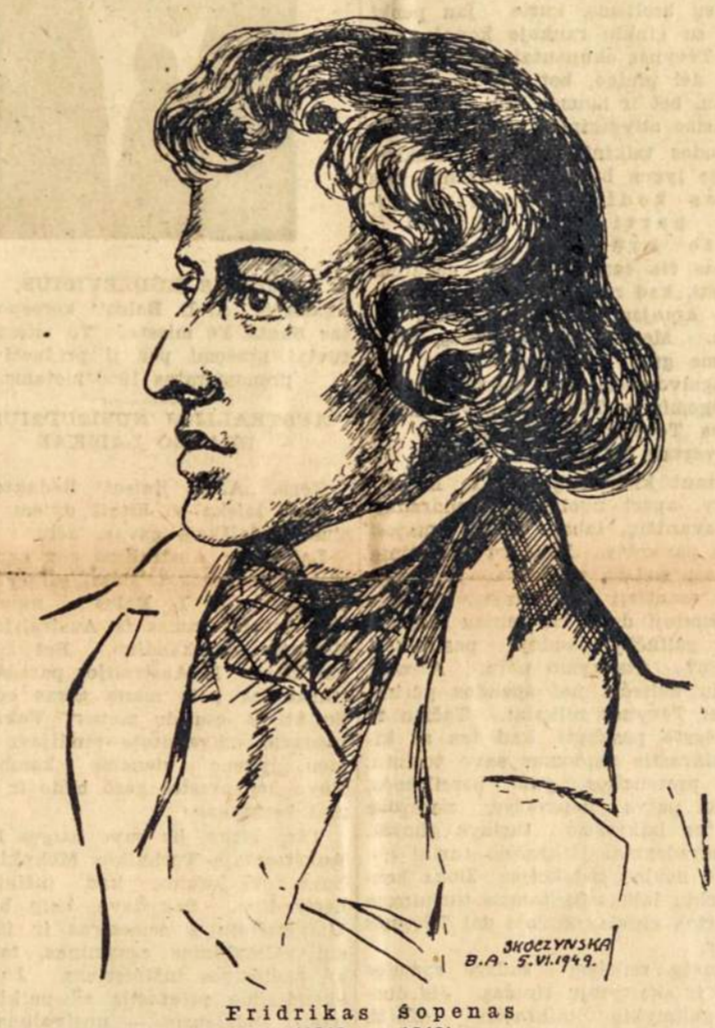
Fridrikas Sopenas (1810 — 1849)