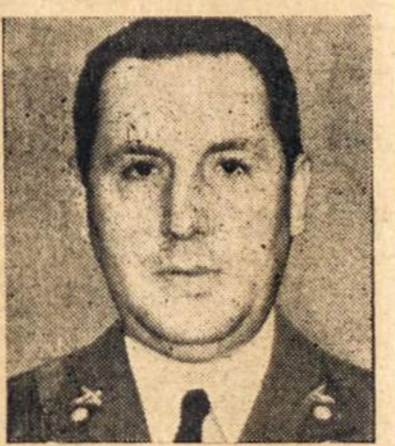
BRIG GEN. JUAN D. PERON, Argentinos Respublikos prezidentas, išrinktas 1946—1952 metams. Padaręs daugybę didelių reformų šioje šalyje, yra rimčiausiu kandidatu į prezidentus ir sekantiuose rinkimuose.

Vyriausybė (1946—1952): Argentinos Respublikos Prezidentas, Brigados Generalas Juan Domingo Peron. Viceprezidentas: Dr. J. Hortensio Quijano. Yra 20 ministerijų su savo sekretariais. 83-čiame senatė yra 17 senatorių ir 145 kongreso narių.