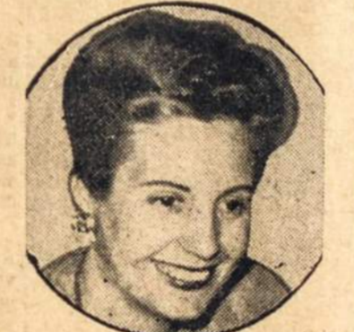
MARIA EVA DUARTE DE PERON, Argentinos Respublikos prezidento žmona, ryžtingai dalyvaujanti šios šalies pažangos pakelyme visose gyvenimo srityse, nenulstama visuomenininkė, darbo žmonių užtarėja.

Gyvulininkystės parodoje, įvykusioje rugpjūčio mėnesį, 1949, Buenos Aires žemės ūkio Stadione, (63-čioj iš eilės), visiškių gyvulių paroda už $ 7.489.185.— Shorthorn čempionas paroda už $ 100.000, campeon senior už $ 40.000, čempionas (gimęs 7. 5. 48) už $ 84.000, Olandų veislės bulius už $ 40.000 ir t. t. Gavę premijos ir aukštomis kainomis pardavę gyvulių augintojai savo išaugintus arklus, avinus ir kiaules. Bitininkystė ir paukštinkystė Argentinoje kas kart modernizuoja vedama ir duoda didelius pelnus.