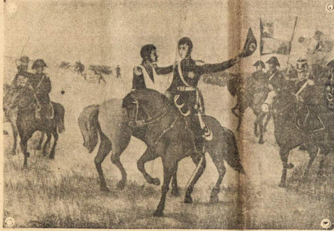
Argentinos nepriklausomybės kovų didvyris gen. San Martín susitinka su čilės gen. O'Higgins.