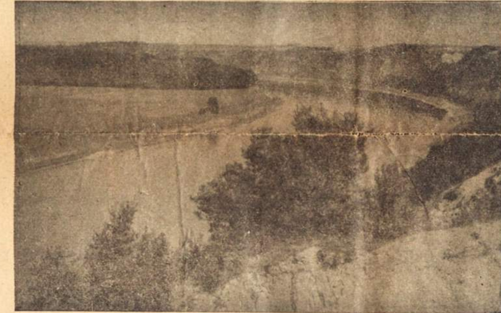
TEN, KUR NEMUNAS BANGUOJA... Zavėtinias Lietuvos upių tėvas Nemunas srauniai plaukia į Baltijos jūrą, pro miestus, miestelius ir kaimus, dabar okupantų verčiamus valdiškais dvarais o Nemuno alies valstiečiai paversti baudžiauninkais.

Sudiev, mergučėle, Balta lėlijule, Aš tau parašysiu Margą gramatėlę. Kas man iš to rašto, Margos gramatėlės, Jeigu nematysiu Savo bernučėlio.