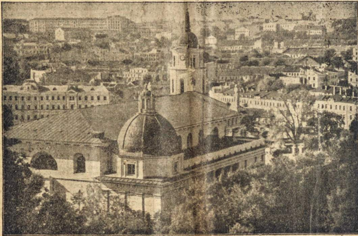
Lietuvos sostinės, Vilniaus, vaizdas. Istorinė Lietuvos valstybės širdis, mokslo ir kultūros centras. Dabar Vilnius randasi Sovietų Rusijos okupacijoje. Vilniuje, kaip lygiai visoj okupuotoj Lietuvoj, vyknamas žiaurus genocidas, mūsų tautos žmonių naikinimas.