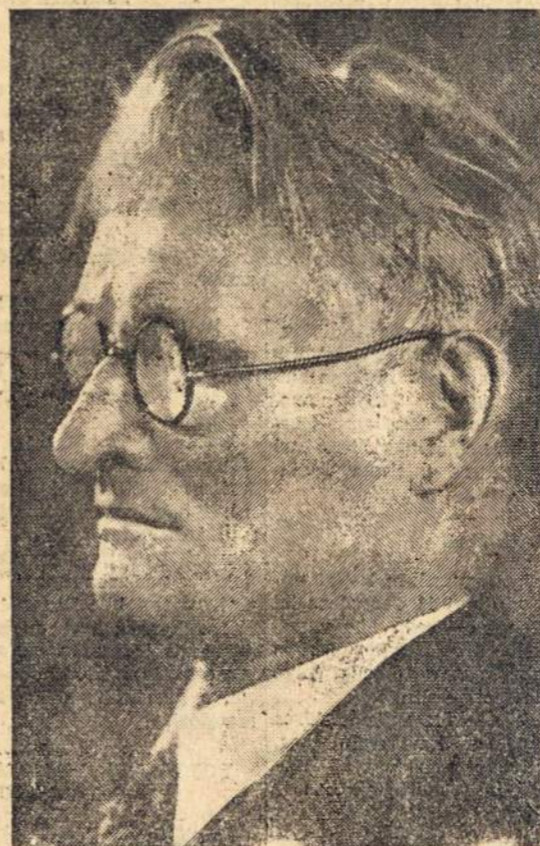
A. A. DAKTARAS KAZYS GRINIUS, (17. XII. 1899 — 5. VI. 1950)

medicinos gydytojas, mokslininkas, rašytojas, rektorius, varpininkas — demokratas, kuris nuopėlais mūsų tautai prilygsta Kudirkai ir Basanavičiui, Lietuvos Liaudies 1926 metais išrinktas Respublikos prezidentu, sąmokslininkų nuverstas, nenuostoj dirbes iki paskutinės savo gyvenimo v. landos. Amžinai užmerkę akis Chicagoje 5. VI. 1950, sulaukęs 83 m. amžiaus. Plačiau — sekančiuose „A. L. Balsu“ numeriuose