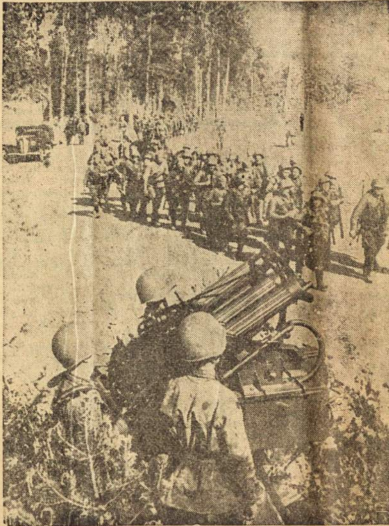
Ir vėl pasikartoja netolimo karo vaizdai, ir vėl liejasi žmonių kraujas...