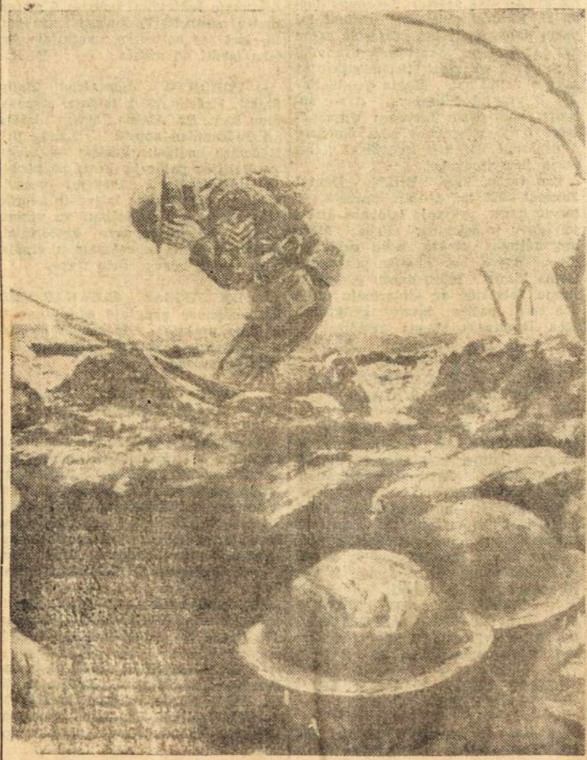
Dar kartą Amerikos kariai žūsta demokratijos gelbėjimo kovoj, ši kartą Azijoje. JAV karių eilėse vėl žūsta daug mūsų kraujo brolių lietuvių.