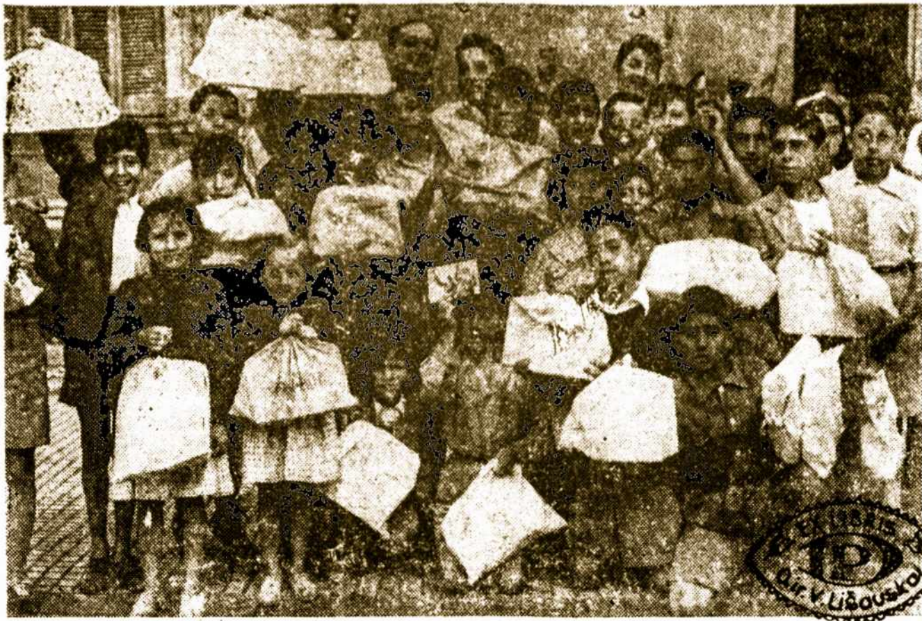
Trijų Karalių šventės proga, 6. I. 52, Eva Perón vardo Labdaros Organizacija Argentinos vaikams išdalinė dovanų už 1 milijonus pezų. Pavėiksle — linksmos mokinės ir mokiniai Miguel de Azcúenaga vardo pradžios mokyklos, Buenos Aires.

El abastecimiento se hace cada día más exigente y apremiante en el mundo y la solución de este complejo problema es el objetivo principal del