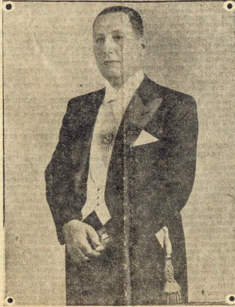
J. E. GEN. JUAN DOMINGO PERÓN, Argentinos Respublikos prezidentas, kurio paskelbtas Antras Penkmetinis Darbų Planas (1953 - 1957) numato daug reformų pagerinimų visose šalies gyvenimo srityse.

Daug dėmesio kreipiama į pagerinti mokslo lyginis. Praplėčiama ligoninių erdvė, suteikiant vietos dar 1,500