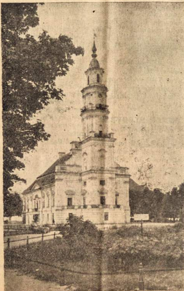
Kauno Rotušė — “Baltąja Gulbe” vadinta, primena mums Nepriklausomybės laikus, ypatingai dabar, Kalėdų metu, sniegu apklotą Kauną prisimenant...

KALĖDOS IR NAUJŲ METŲ SUTIKIMAS LIETUVIŲ CENTRE, Tabaré 6950, Villa Lugano, Buenos Aires, įvyks visai mūsų kolonijai: Gruodžio 25, pavarake, prie Kalėdinės Eglutės, Kalėdų Diedukas dalins saldinius visiems lietuvių vaikeliams. Gruodžio 31, visi lietuviai kviečiami atvykti į Lietuvos Centrą sutikti Naujosius Metus. Šia proga Lietuvos Centras sveikina savo narius, simpatizantus ir broliškas organizacijas su Kalėdomis ir Naujaisiais Metais. Lietuvių Centro Valdyba.