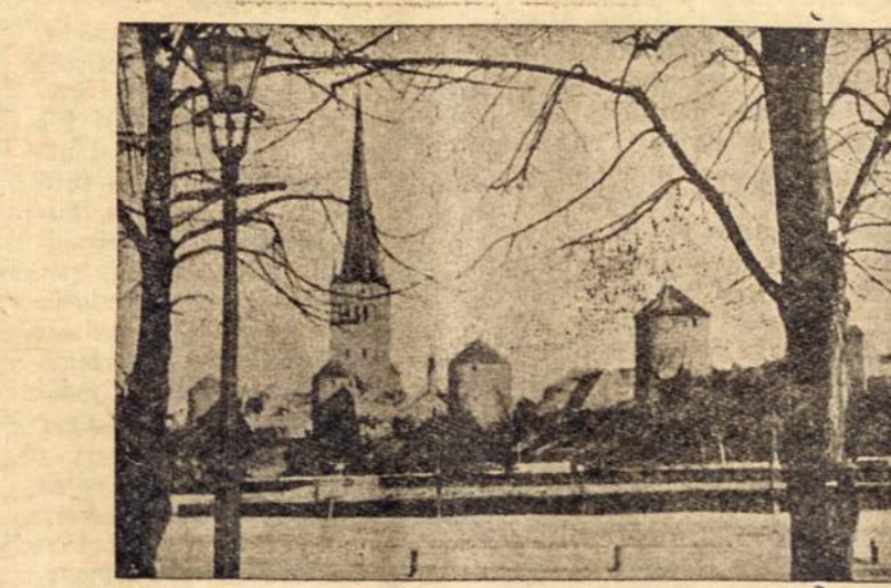
Estijos nepriklausomybės paskelbimas įvyko vasario 24, 1918 m. Ši mini šį sekmadienį, 21. 2. 1954. Ryte bus pamaldos Buenos Klube. Vaizduose: Viršuj, kairėj — Tallino pilis, dešinėj — Tallino bokštai, dešinėj — Estijos valstiečio sodyba, dabar