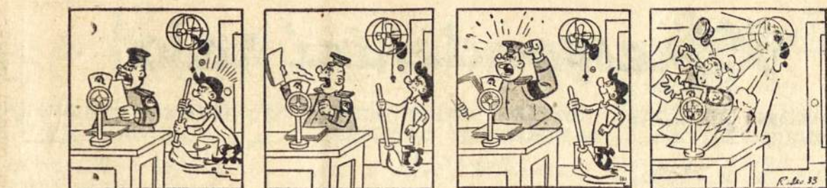
Slavikui nusibodo klausyti darbininkų vado kalbą "rojuje" ir jis jam pagelbėjo ventilatorium.

LIETUVIŲ KRAUTUVŲ Casa "CAPIOVA" Parduoda loterijos bilietus, mokyklos reikmenis, šašlams, etc. PENTAS VAJONKONIS, sav. Warnes 378 Villa Crespo