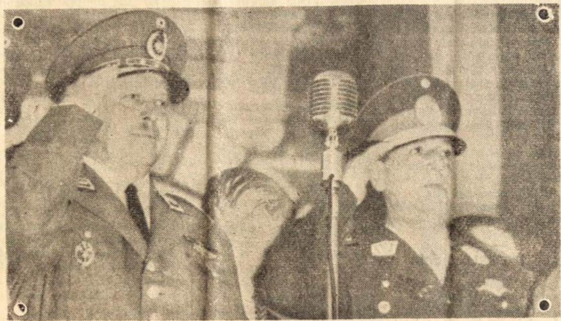
Argentinos prezidentas gen. J. D. Perón (dešinė) ir Paragvajaus prezidentas gen. Alfredo Stroessner Asuncione 16. 8. 1954, sustiprino broliškų tautų draugingumą, Argentinai graži nuos Paragvajui 1870 metų karo trofėjus