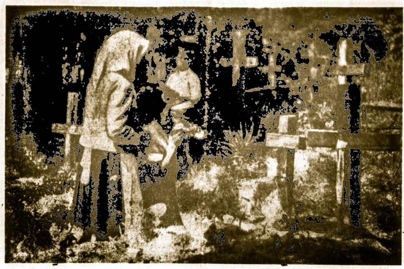
Lietuvė močiūtė-sengalvėlė su anūkais Vėlinių dieną (lapkričio 2) lanko savo brangiųjų kapus. Karo audrai nusiautus, daug naujų lietuvių kapų supilta okupu otoj Lietuvoj, tremty ir iševiojje.