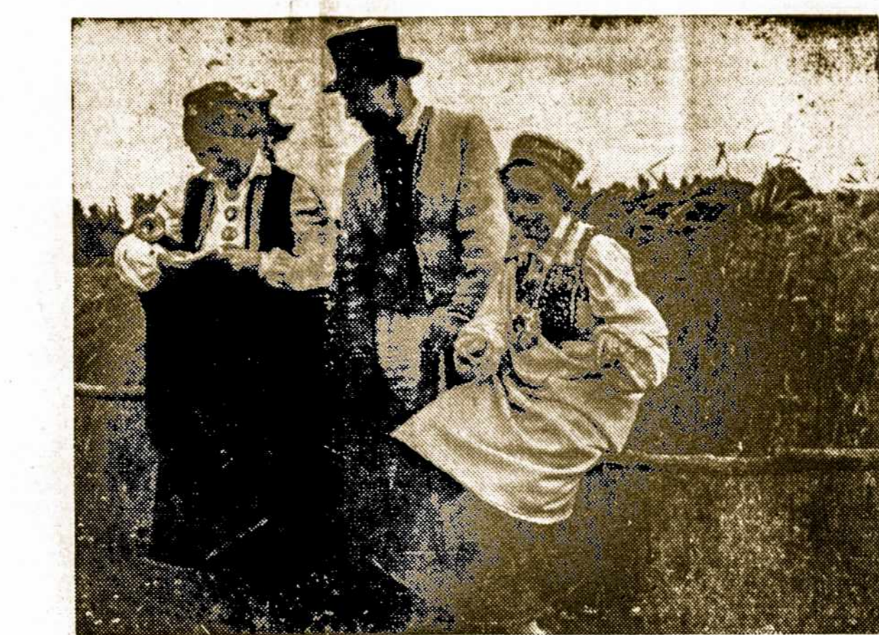
Mūsų brolių tautos, latvių jaunimas savo tautiniuose rūbuose Nepriklausomos Lat- vijos kaime. Argentinos latvių Sąjunga Latvijos Nepriklausomybės paskelbimo. 36 metų sukaktį mini šį šeštadienį, 20. XI. 1954, Rodriguez Peña 254, Buenos Aires.

Labai dažnai oficialinės Ar- gentinos įstaigos savo statisti- kose pabrėžia puikų šalies sto- vį finansų ir valiutų atžvilgiu.